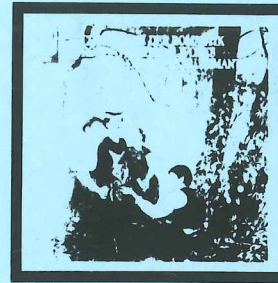
CHORWERKE DER ROMANTIK Mädchenchor Hannover Ltg.: Ludwig Rutt EMI - deutsche harmonia mundi Digitally remastered EL 1695 891